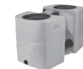
Drainbox 600 1400