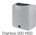
Drainbox 300 1400